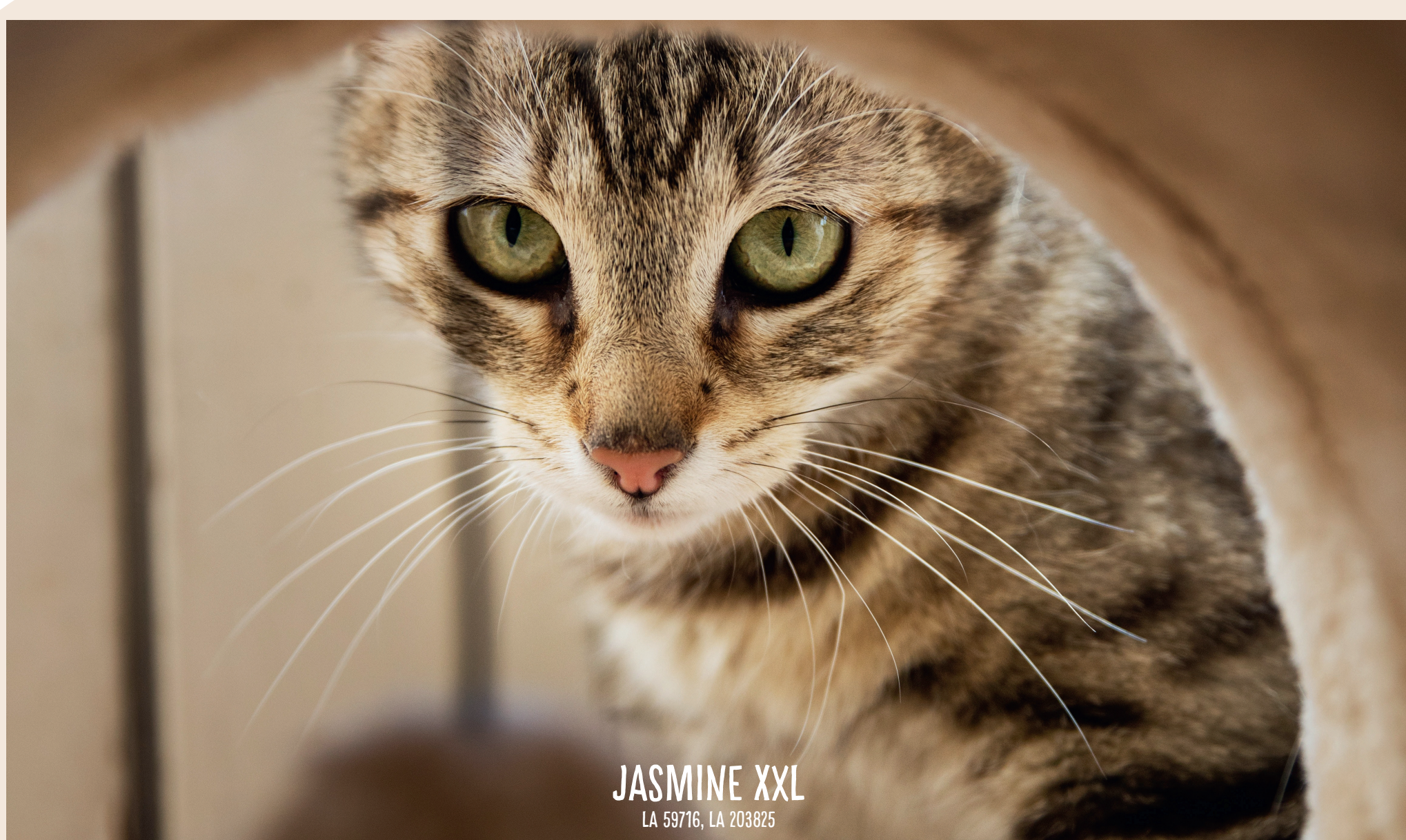
JASMINE XXL LA 59716, LA 203825

HOW DO WE SHOW OUR CATS BEST THAT WE LOVE THEM?