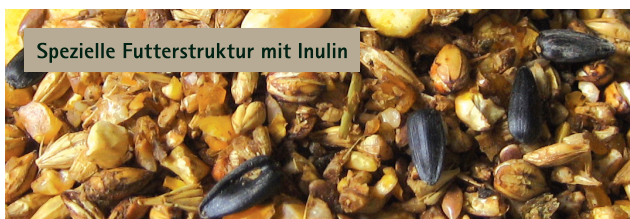
Spezielle Futterstruktur mit Inulin

Die spezielle Struktur des Futters führt bereits im Kauprozess zu einer sehr guten Einspeichelung – Grundlage für den natürlichen Eigenschutz des Pferdemagens vor den aggressiven Bestandteilen seiner eigenen Magensäure. Zusammensetzung und differenzierter Aufschluss des Getreides gewährleisten eine optimale und nachhaltige (periodengerechte) Energiebereitstellung. Die daraus resultierende, verbesserte Energieausbeute ermöglicht die Reduzierung des Kraftfutters zu Gunsten des wirkstoff- und faserreichen Raufutters (Heu und Stroh), wodurch der Verdauungsprozess insgesamt erleichtert und zusätzlich geholfen wird, die Darmflora neu zu entwickeln bzw. sie im Gleichgewicht zu halten.